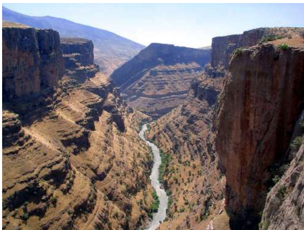
Un canyon près de RAWANDIZ