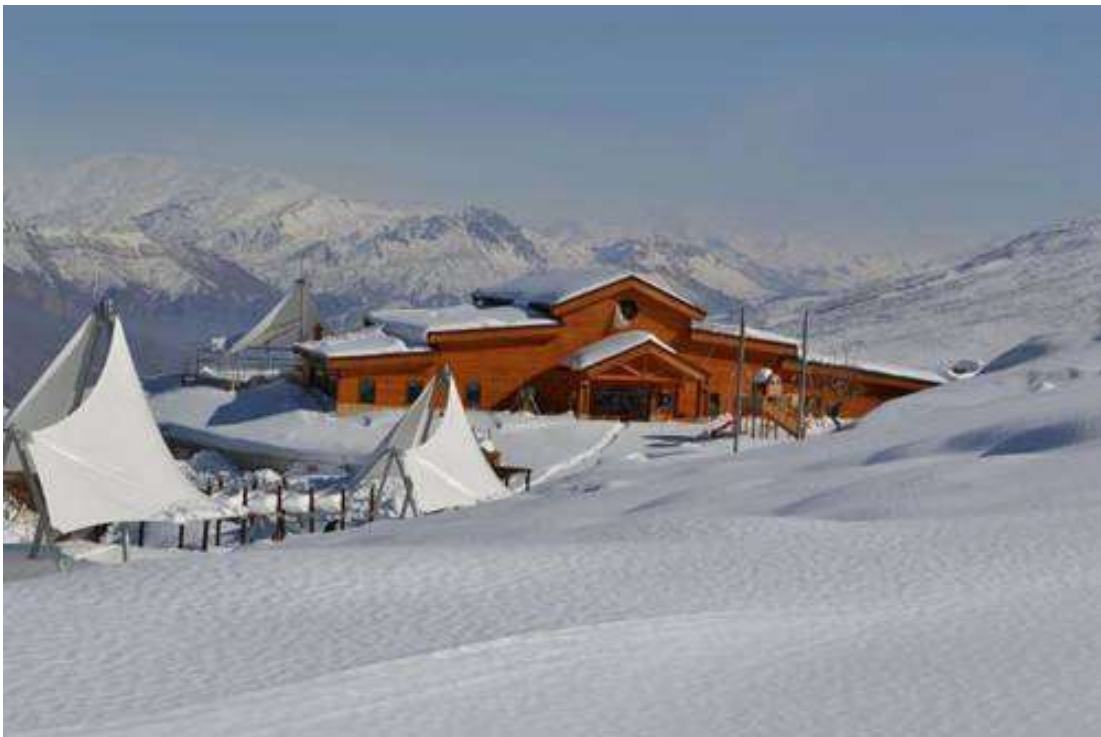
Infrastructure touristique dans la station de sports d'hiver & Spa de Korek

D'autres sites touristiques sont réputés notamment pour le tourisme rural, ils accueillent pour la plupart des touristes locaux, tels que la vallée de Gali Ali Beg qui s'étend 12 km, où l'on trouve la cascade de Ali Beg et la cascade de Bekhal, Jondian et Barzan dans la province d'Erbil ; les sites touristiques connus dans la province de Sulymaniah sont Serchinar, Dokan, Ahamdawa, Hawraman : à Duhok les plus connus sont : Anishké, Solav, Sersing, Akre.