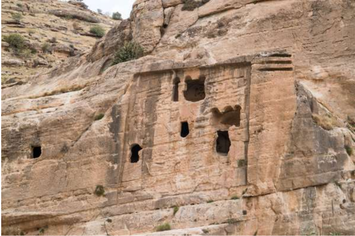
Bas-relief néo-assyrien de Khinnis

La ville d'Erbil, qui est l'une des villes les plus anciennes et continuellement habitée du monde, elle est le foyer de la plus ancienne citadelle, dont on trouve mention dans des tablettes de 2.300 av. JC, inscrite au patrimoine mondial de l'humanité par l'UNESCO en 2014 et qui est maintenant en cours de restauration.