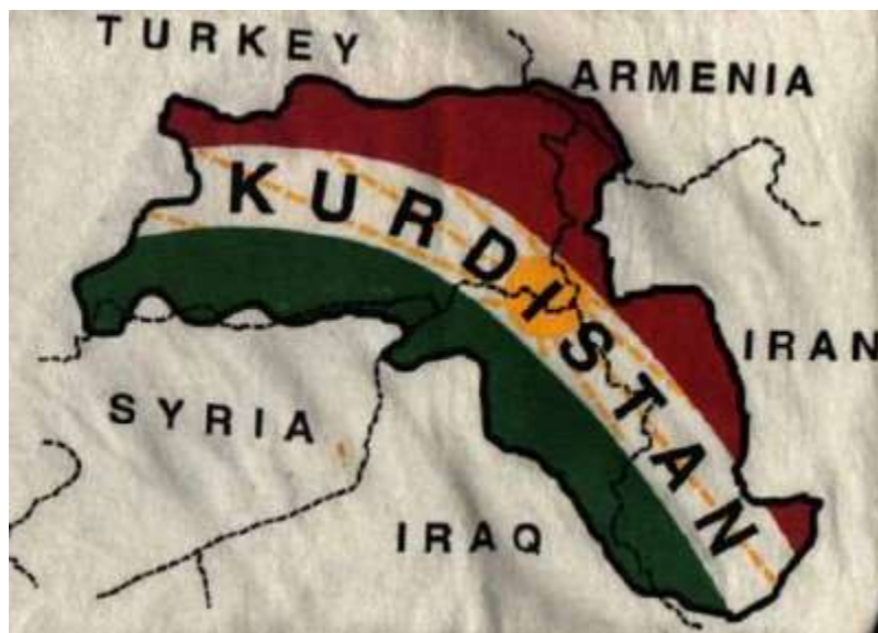
Carte du Kurdistan tel que souhaité par les autonomistes

En 2003, les Américains ont été accueillis par les Kurdes comme des libérateurs avec de nombreuses fêtes et danses spontanées dans les rues. Les zones sous contrôle des peshmergas se sont étendues. A cette époque, la situation économique en Irak était fragile à cause des guerres et de sanctions économiques des Nations Unies. Le pétrole générant le chiffre d'affaires économique essentiel pour l'Irak et au Kurdistan. Du 14 juin 2005 au 1 er novembre 2017, Massoud Barzani a assumé les fonctions de Président du Kurdistan Irakien. Cette fonction a été suspendue avant d'être réactivée pour le 8 mai 2019. Un référendum devait avoir lieu en 2007 pour déterminer les frontières définitives du Kurdistan Irakien, mais il fut indéfiniment reporté. En juin 2014, durant la seconde guerre civile irakienne, l'offensive des djihadistes de DAESH et la débâcle de l'armée gouvernementale ont permis au Kurdistan d'incorporer Kirkouk et d'autres territoires contestés.