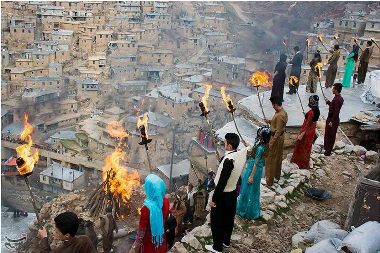
Célébration de la fête de Newroz à Akré

Dans de très nombreux villages et tribus de Kurdistan (Hawler, Sulemanie, Duhok, Akré ... etc.) des rituels publics spéciaux associés aux feux sont observés au cours des célébrations. Les habitants allument des feux et sautent par-dessus, mais également ils dansent autour du feu en chantant des chants traditionnels kurdes. Plusieurs organisations organisent des spectacles de musique et de danse, des expressions et de la littérature orale pour transmettre aux jeunes les savoirs ancestraux.