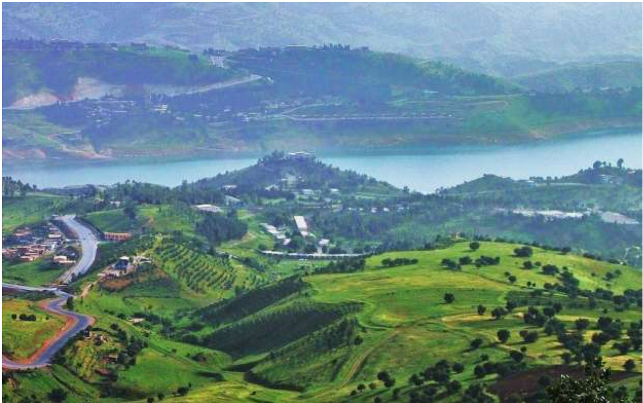
Le lac DUKAN