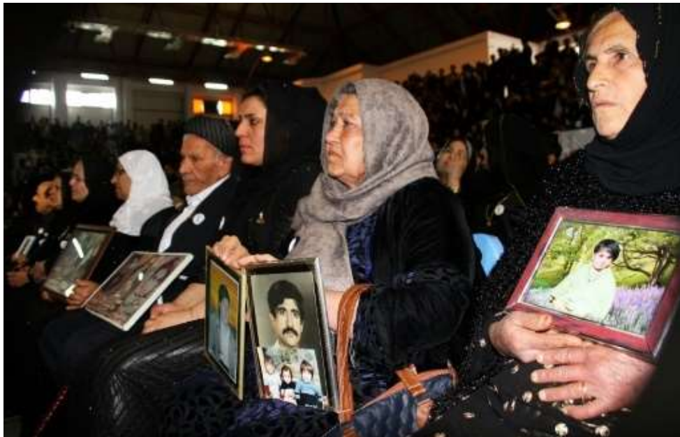
Mères de victimes des tués par le régime de Saddam Hussein (l'Express)

En Mars 1991, la rébellion Kurde éclate, menée conjointement par le Parti Démocratique du Kurdistan (PDK) et l'Union Patriotique du Kurdistan (UPK) face à la violente répression (entre 500.00 et 1.000.000 de victimes), le Conseil de Sécurité de l'ONU déclare une zone « abri sûr » pour les réfugiés kurdes.