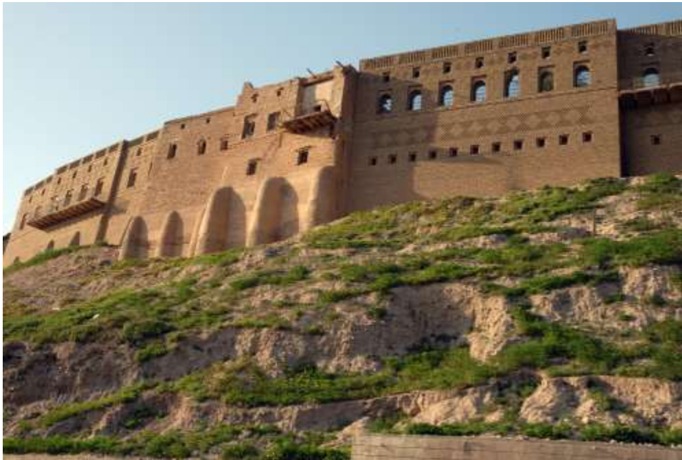
La citadelle d'Erbil

( ABDOL MAJID A., (2003), « L'avenir du tourisme en Irak », p180-181)