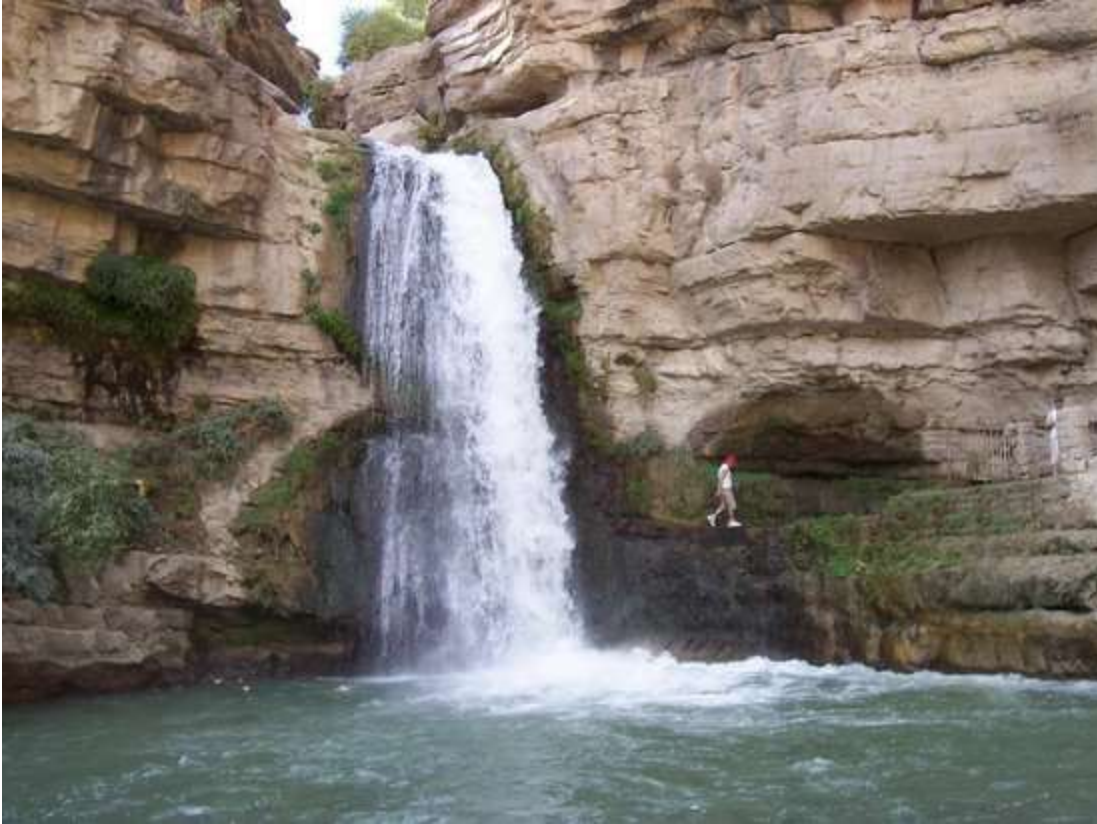
La Montagne et les chutes d'eau de Daban