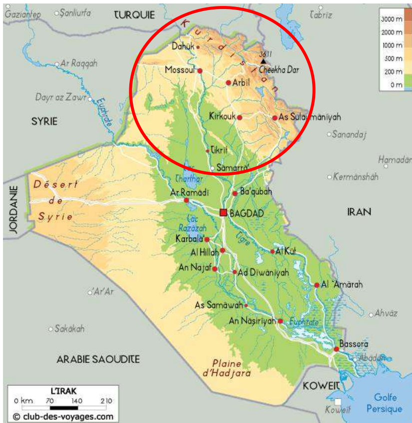
Carte Actualitix (2019)

Les parties occidentales et méridionales de la région se composent de collines et de plaines couvertes alternativement d'une garrigue et d'une steppe herbeuse. Les reliefs sont nettement moins prononcés et les températures généralement plus élevées.