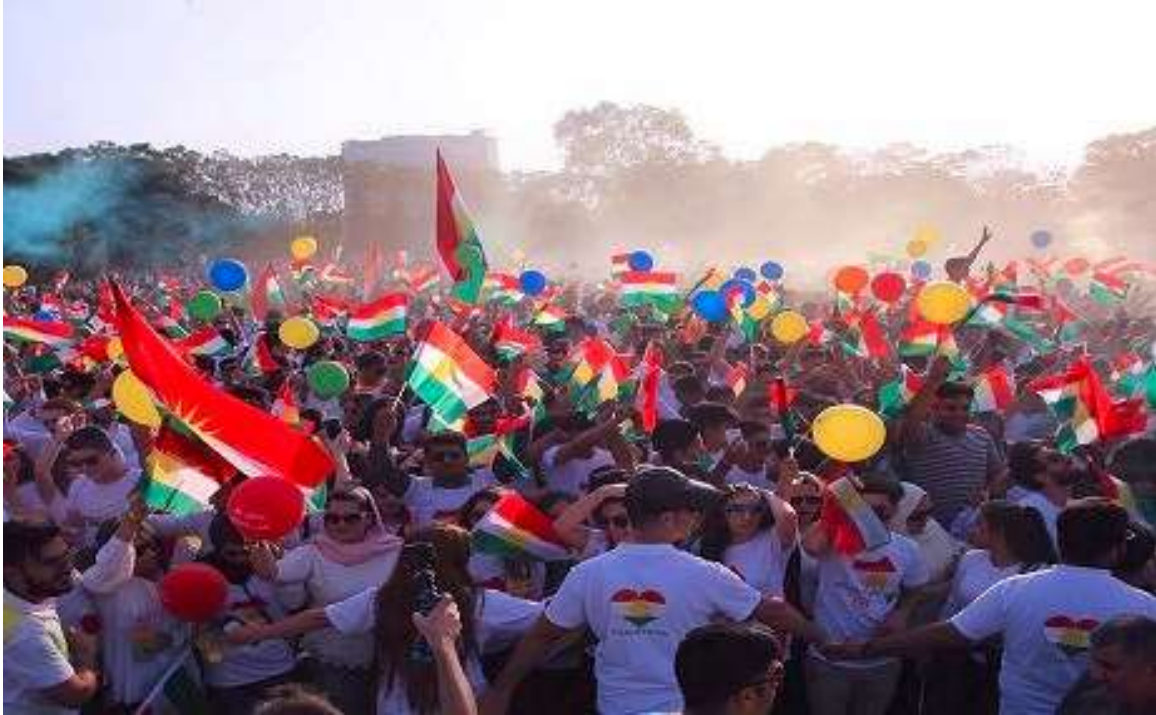
Festival international d’Erbil (2018)

Dans la capitale de la région, chaque année Le Festival international d’Erbil est organisé à cette occasion ; beaucoup de pays y participent par des groupes de musique, ils enrichissent le festival par leur présence et représentent un atout majeur touristique.