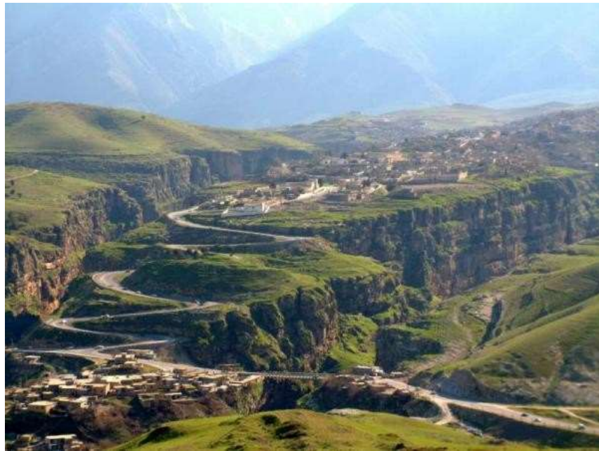
Pank Tourism Complex (Rawanduz)

Sites de beauté historique et naturel en font des endroits idéaux pour les investissements liés au tourisme, les projets achevés comme le Parc Thématique : Pank Tourism Complex dans Rawanduz en sont un exemple clair sur la façon dont la loi d'investissement a permis la création d'un complexe touristique moderne avec des montagnes russes et des attractions placés sur une gorge près de la ville de Rawanduz. Le paysage est à couper le souffle, totalement différent du reste du Moyen-Orient, en passant par les sommets enneigés en hiver et les plaines verdoyantes au printemps.