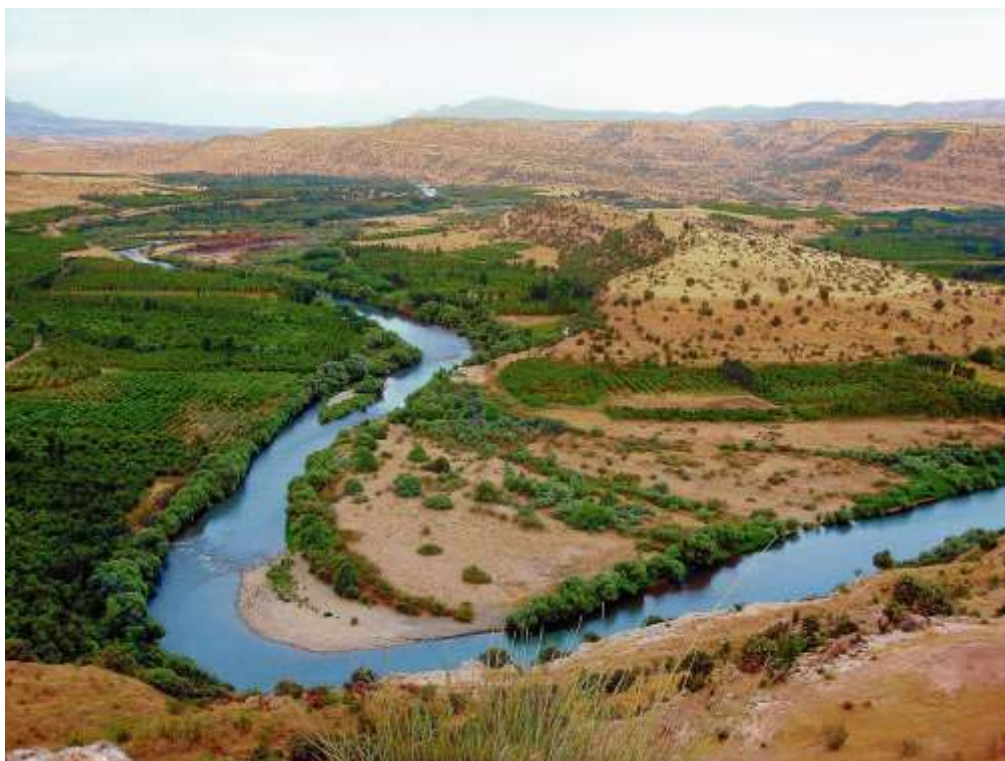
La rivière du grand ZAB (près d'Erbil)