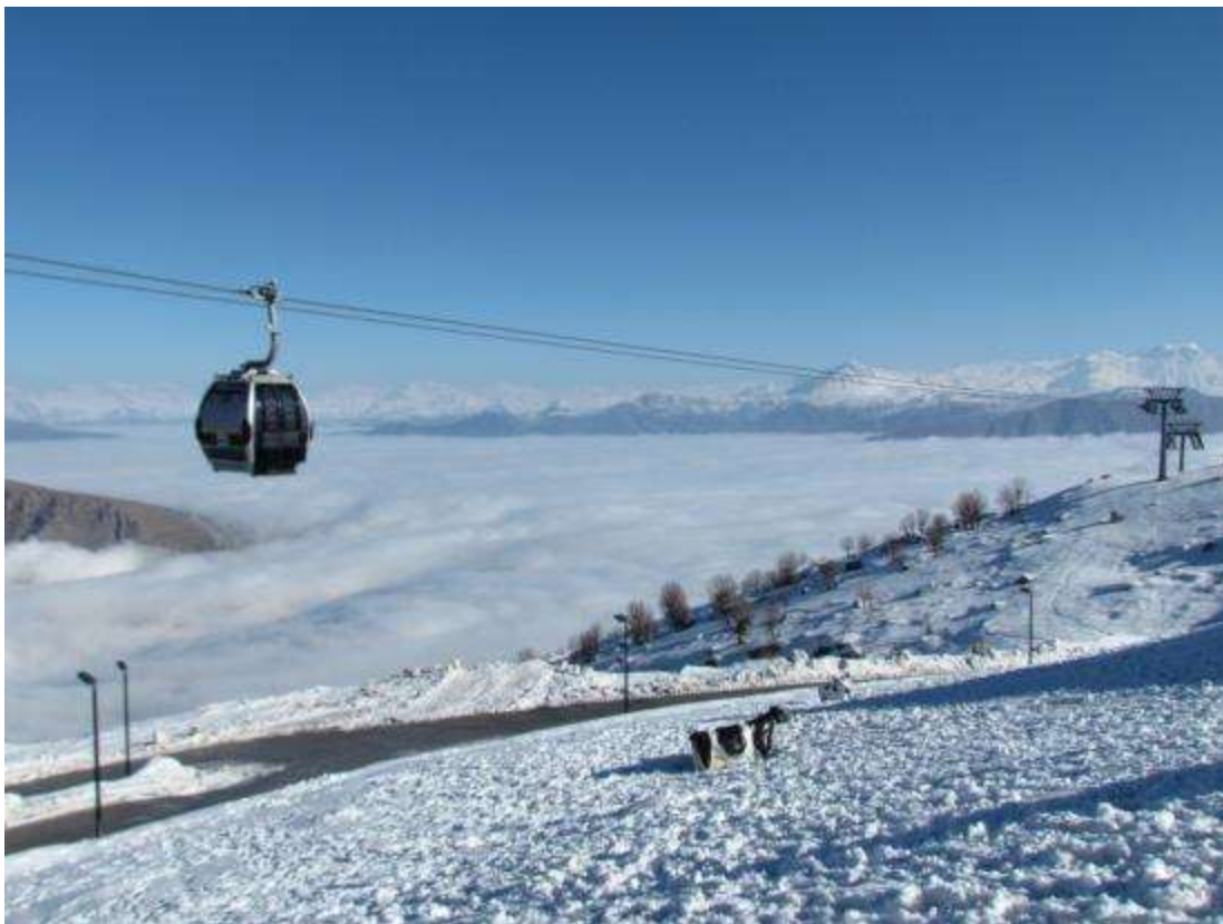
Téléphérique dans la station se sports d'hiver & Spa de Korek

La région est couverte par de très hautes montagnes, les plus connues sont le mont Hsarust qui s'élève à 3.607 mètres au-dessus du niveau de la mer, ainsi que le mont Piera Mgrun dans la province de Sulaimaniyah avec une altitude de 2.620 mètres, enfin la chaîne montagneuse du Zagros est le foyer du deuxième plus haut sommet de l'Irak, le sommet de Halgurd, qui s'élève à environ 3.607 mètres. Ces hauts sommets sont considérés comme de véritables sites d'attraction touristique, car ils reflètent la magnificence des paysages naturels encore sauvages de la région avec leurs forêts, leurs vallées et leurs cascades naturelles. Dans d'autres montagnes telles que le Mont Korek et le Mont Safen, des stations touristiques ont déjà été construites pour attirer plus de visiteurs et diversifier les loisirs. Ainsi la bi-saisonnalité montagnarde sera un atout considérable pour le tourisme de la région dans les années à venir.